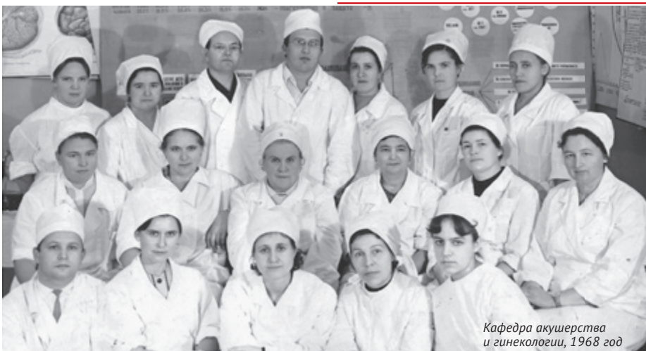
Кафедра акушерства и гинекологии, 1968 год